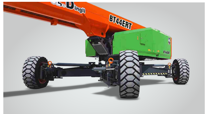
Nova tecnologia de expansão de eixo in situ de uma chave Proteção global de patentes