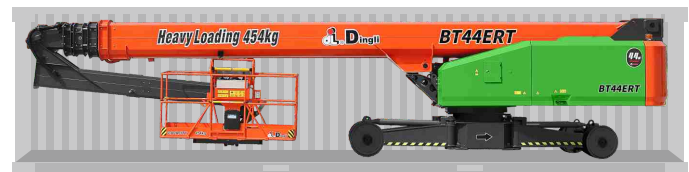
Transporte de contêineres padrão