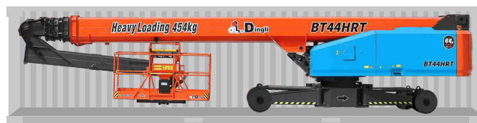
Transporte de contêineres padrão