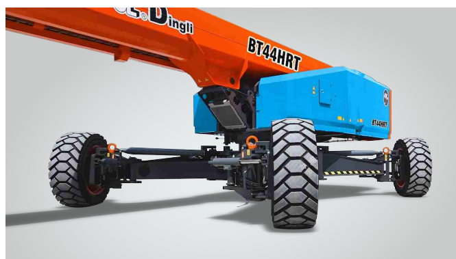
Nova tecnologia de expansão de eixo in situ de uma chave Proteção global de patentes