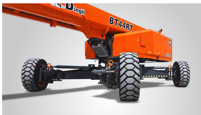
Nova tecnologia de expansão de eixo in situ de uma chave Proteção global de patentes