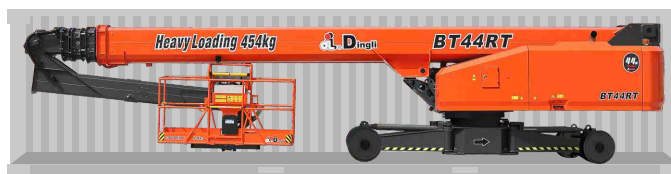
Transporte de contêineres padrão